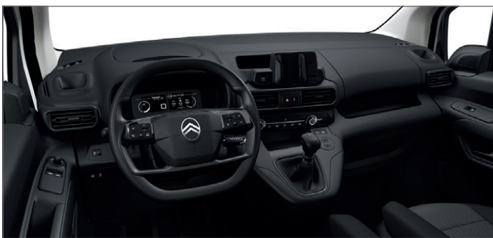
Interiér Látka Brasilia Černá - CMFY