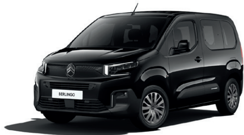
Černá PERLA NERA (M)