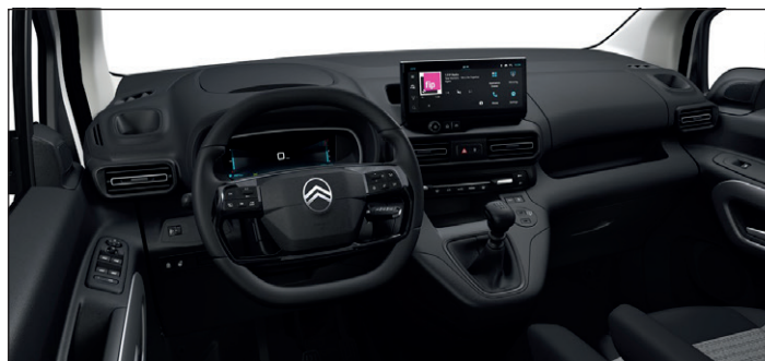
Výbava MAX - Látká LINE Šedá