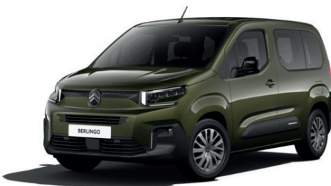
Zelená SIRKKA (M)