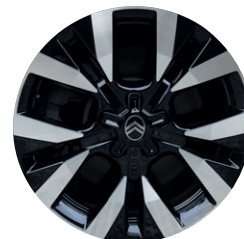
Hliníkový disk TOPAZ R17