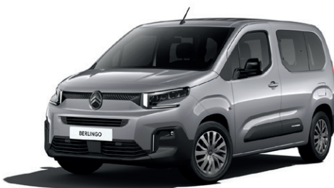
Šedá ARTENSE (M)