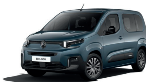
Modrá KIAMA (M)