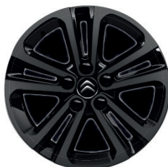
Hliníkový disk (celo-černý) STARLIT R16