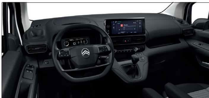
Výbava PLUS - Látká LINE Šedá