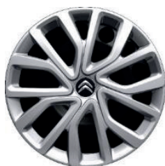
Okrasný kryt TWIRL R16 - černý střed